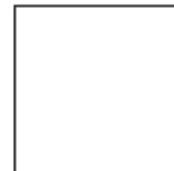
Modelo 4 - Carteirinha