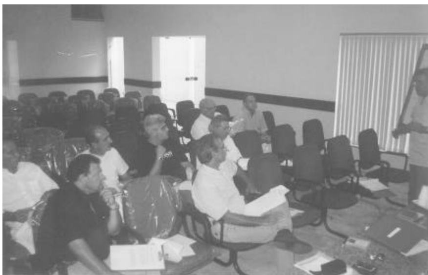
Fig. 7 – Diretores Executivos e Consultivos da Febraps