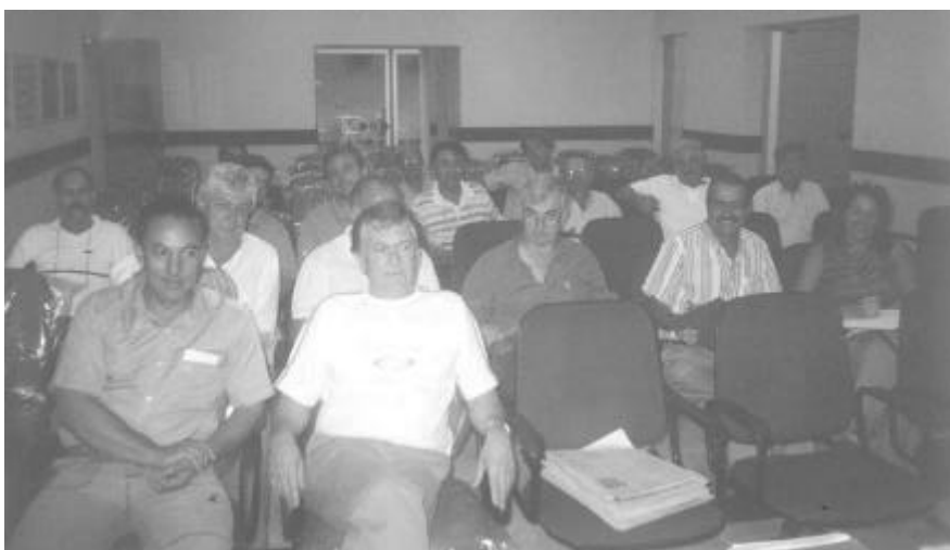
Fig. 6 – Diretores Executivos e Consultivos da Febraps

Vale ressaltar, que a Febraps está fazendo a distribuição das atas das reuniões e os sócios poderão ver a íntegra de todos os assuntos discutidos pelos diretores. Basta o interessado solicitar a consulta da ata e apontar o dia da reunião.