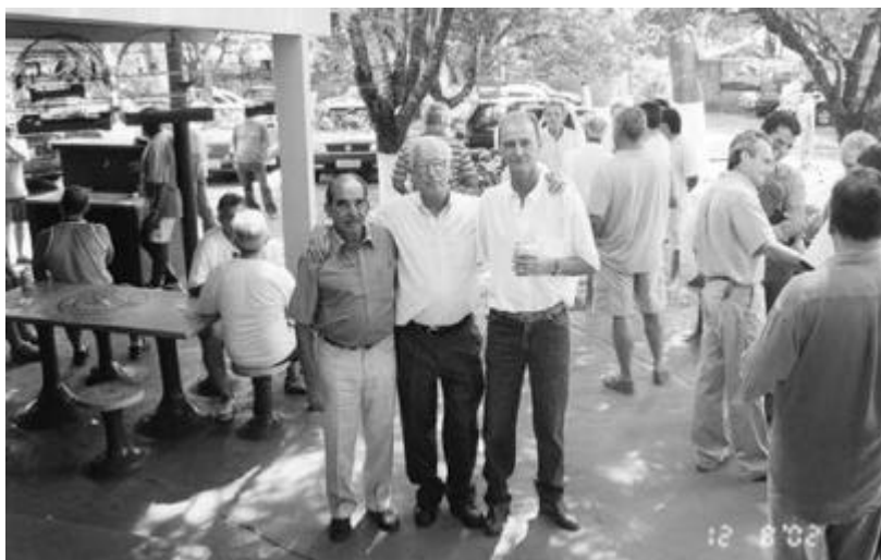
Fig. 2 - O Presidente Elpídio ao Lado de Associados