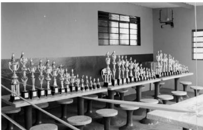
Fig. 3 - Bonitos troféus foram ofertados aos ganhadores